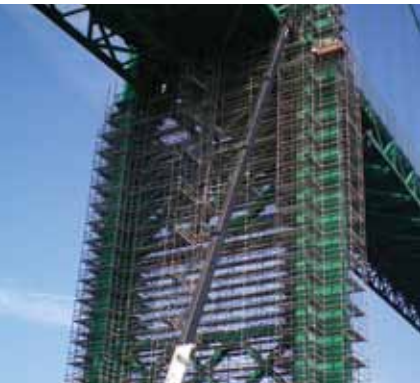
En esta página (hacia la derecha): Puente Alexandra (Ontario y Quebec, Canadá); Puente Lewis & Clark (Rainier, OR y Longview, WA); Puente Vincent Thomas (Long Beach, CA).